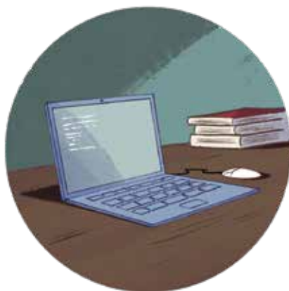
Ilustración César Barceló